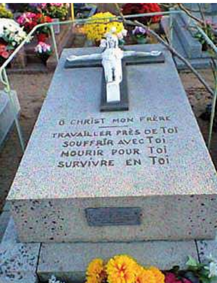
Tombe de Gabrielle Bossis.

Gabrielle a cherché toute sa vie à demeurer en union avec Dieu sans se décourager. On peut la prier pour qu'elle nous aide dans cette quête de l'amour de Dieu en toute chose de la vie.