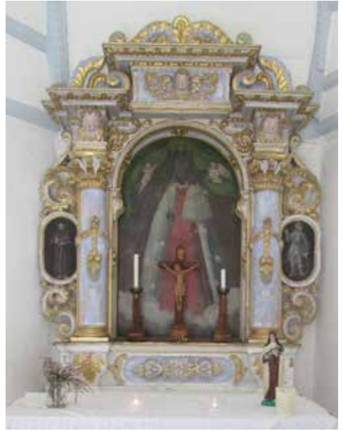
Le retable de la chapelle.

C'est après cette date qu'il faut situer la construction de la chapelle.