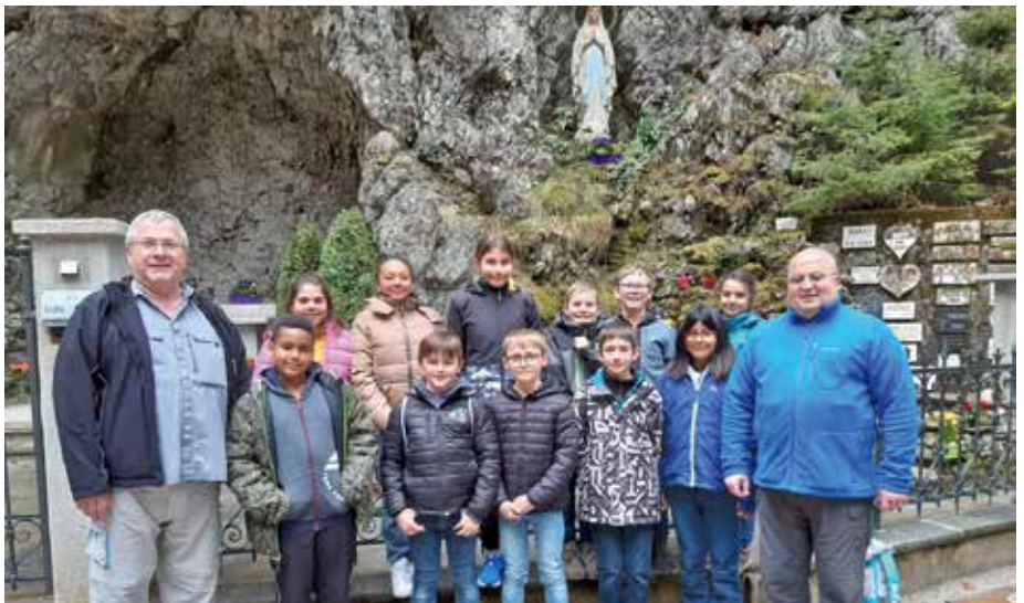
Enfants de 6H devant la Grotte de Lourdes à Grandvillard

Les prêtres et les accompagnants ont passé un bel après-midi en compagnie de ces enfants: merci à eux pour leur participation lumineuse!