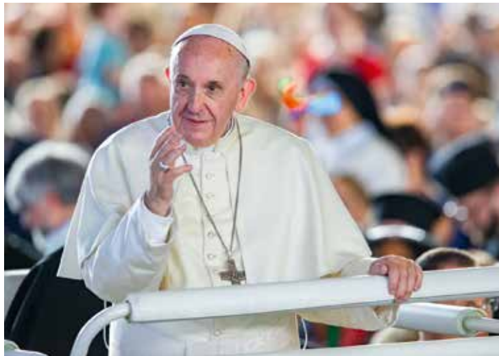
Le Pape catéchiste.

PAR L'ABBÉ JOSEPH