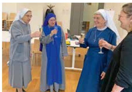
Verre de l'amitié après la signature.

nous réunir afin de remercier de vive voix les sœurs d'Ingenbohl et d'accueillir avec joie nos nouvelles Sœurs, dont l'une d'elles rejoindra l'EP.