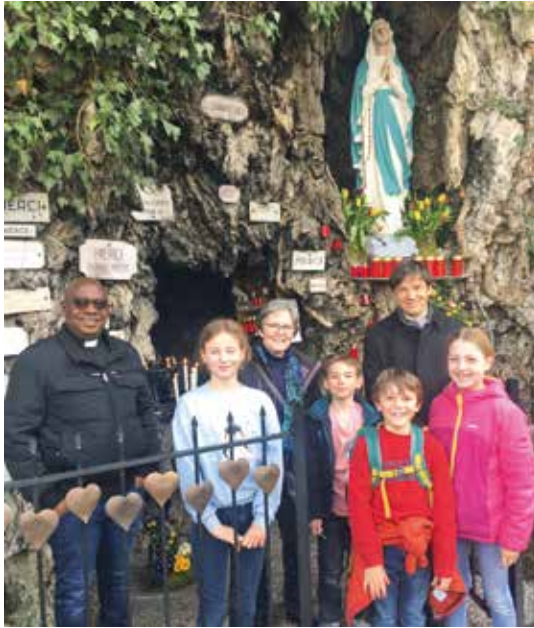
Enfants de 6H devant la grotte de Lourdes à Charmey.

étaient invités à participer à une célébration pénitentielle. La proposition était également ouverte aux enfants des classes de 8H.