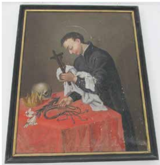
Tableau représentant saint Aloys.

sans sondage, avec destruction possible d'un décor peint caché.