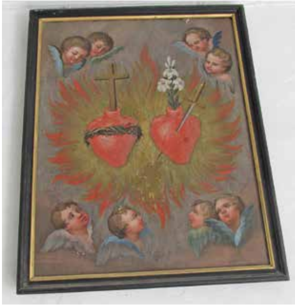
Tableau des symboles du Sacré-Cœur et de la Vierge.