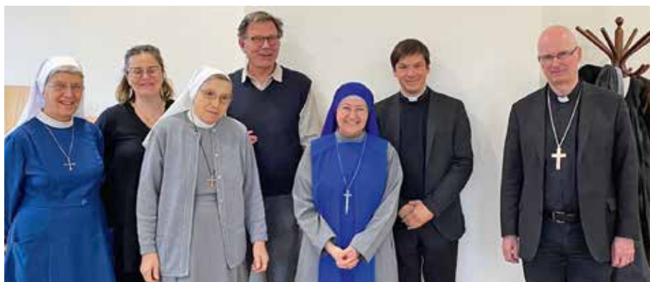
Merci aux sœurs.