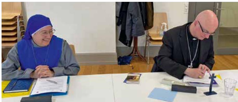
Signature de la Convention.