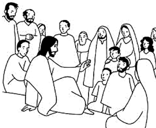
Jésus a enseigné.

nelle qui sera scellée par le Sang de son Fils sur le bois de la Croix. Jésus illuminera l'intelligence du cœur des disciples d'Emmaüs en leur interprétant dans l'Écriture tout ce qui le concernait 2 . L'Ancien Testament regroupe un ensemble de livres précieux pour bien comprendre le Nouveau Testament. Car la Bible dans son entier révèle l'origine de l'homme et sa destinée finale : « Dieu, infiniment Parfait et Bienheureux en Lui-même, dans un dessein de pure bonté, a librement créé l'homme pour le faire participer à sa vie bienheureuse 3 ». Et pour le former dès ici-bas à se préparer à cette vie bienheureuse, Dieu s'est révélé et a transmis aux hommes ses commandements qui nous aident à vivre selon son Amour. A travers les livres de Sagesse, les livres des récits ou encore à travers le recueil des psaumes, Dieu inspire l'hagiographe pour nous instruire de comment vivre selon