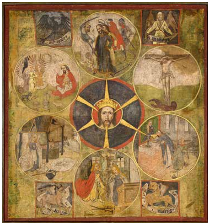
La roue de saint Nicolas de Flüe.

Depuis les débuts de son histoire, l'Église tient en haute estime l'enseignement du catéchisme 9 . Car le catéchisme assure la transmission de la foi et à sa mise en pratique dans une vie conforme à la vérité du dessein de Dieu pour l'homme et la femme. C'est pourquoi le catéchiste tient une place particulière dans la communauté chrétienne, car il aide la communauté à grandir dans la foi. Si la mission propre de l'Évêque est d'être le premier catéchiste dans son diocèse «avec son presbyterium qui partage avec lui la même charge pastorale» 10 , il n'en demeure pas moins que des laïcs formés puissent assurer cette mission au sein d'une communauté.